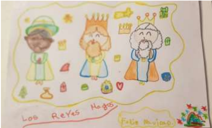
1er Accésit Grupo A

Obsequios Iltre. Colegio Oficial de Graduados Sociales de Zamora.